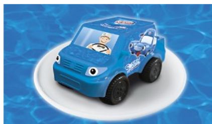
Sunny Car 3,50 €

1 mit Farbstoff 2 mit Konservierungstoff,3 mit Antioxidationsmittel,4 mit Geschmacksverstärker, 5 geschwefelt, 6 geschwärzt 7 mit Phosphat 8 mit Milcheiweiß 9 koffeinhaltig 10 chininhaltig 11 mit Süßungsmittel 12 enthält eine Phenylalaninquelle 13 gewachst 14 mit Taurin 15 100 % Saft, 16 Fruchtsaftgetränk, 17 Nektar 18 Nitritpökelsalz, 19 Vanillegeschmack