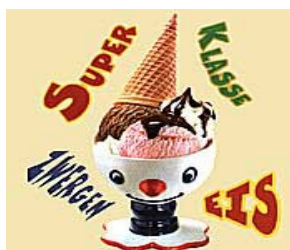
Eiszwerg 2,50 €